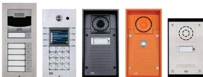
2N° Helios IP Verso