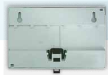
Stenska ali DIN nameštitev